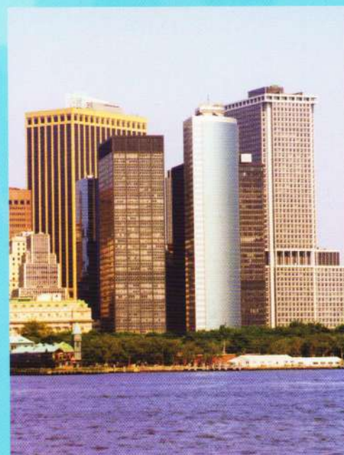
Manhattan, în New York, Statele Unite ale Americii