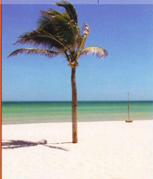
Nisipul tropical alb de pe plajele caraibiene