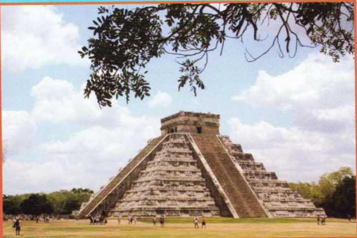
Chichén Itzá, ruine maya din Mexic

Insulele Hawaii Kauai S.U.A. Molokai Oahu Maui Hawaii